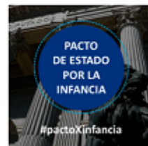
PACTO DE ESTADO POR LA INFANCIA #pactoXInfancia