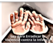
Ley para Erradicar la Violencia contra la Infancia