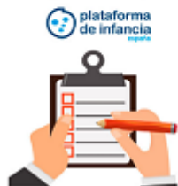
plataforma de infancia