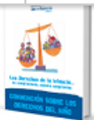
Los Derechos de la Infancia. CONVENCIÓN SOBRE LOS DERECHOS DEL NIÑO