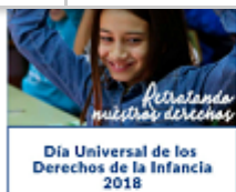
Día Universal de los Derechos de la Infancia 2018