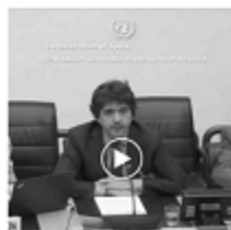
Ley para Erradicar la Violencia contra la Infancia